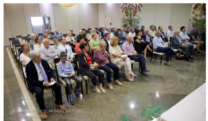
Asistentes a la entrega Premios 2022