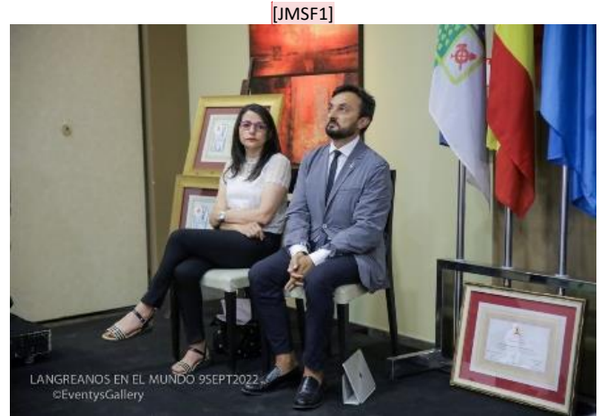
Premiados año 2022