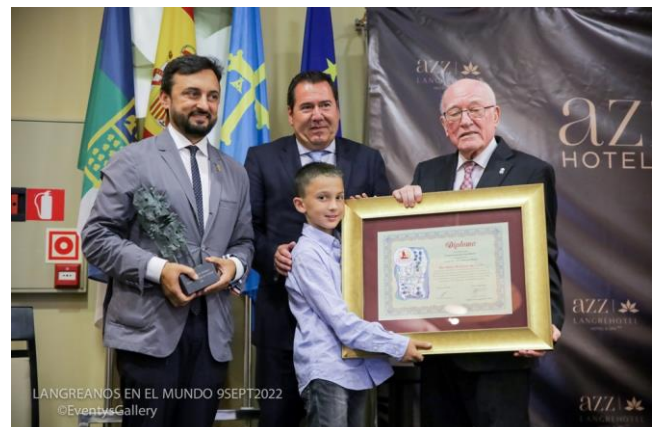
Entrega Premio Langreanos en el Mundo 2022