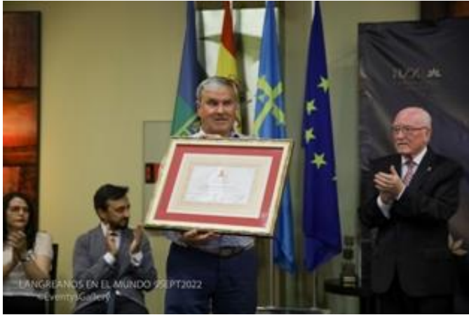
Entrega diploma Asociado de Honor "Che de Cabaños" 2022

En este apartado iremos incluyendo de forma aleatoria fotos de la historia de la Asociación. La mayoría de ellas se pueden ver también en nuestra WEB en el apartado de FLICK, en el siguiente enlace: https://www.flickr.com/photos/44322988@N06/sets/C