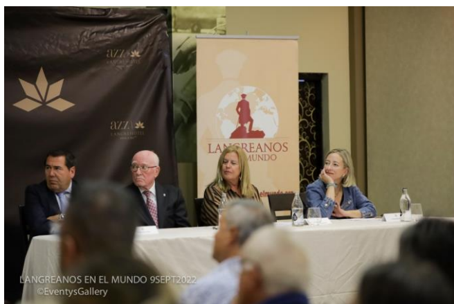
Mesa presidencial entrega Premios 2022